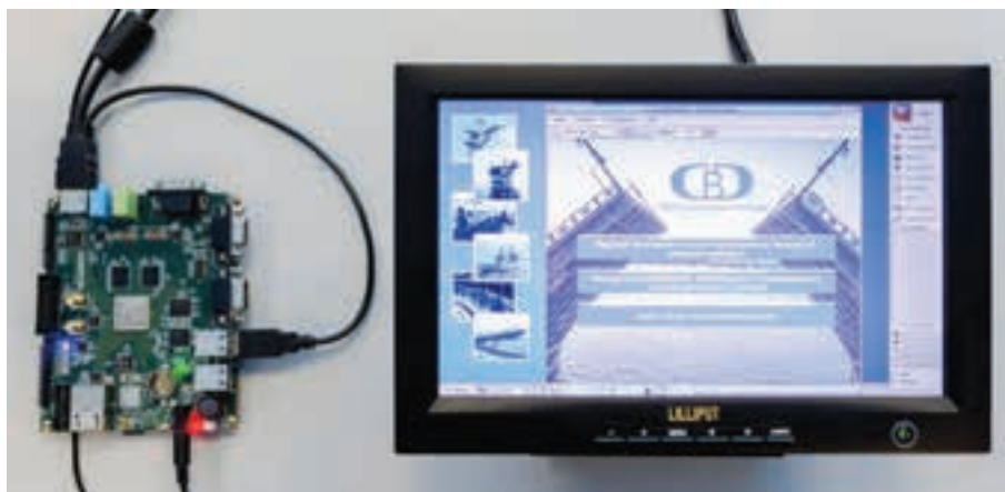
Отладочный модуль Салют-ЭЛ24Д1 с МП 1892ВМ14Я под управлением ЗОСРВ «Нейтрино»

Относительно недавно ЭЛВИС разработал и выпустил в серию микропроцессор 1892ВМ14Я (Мультиком-02) с характеристиками универсального ЦПУ, но в то же время обладающий низким энергопотреблением. Процессор базируется на